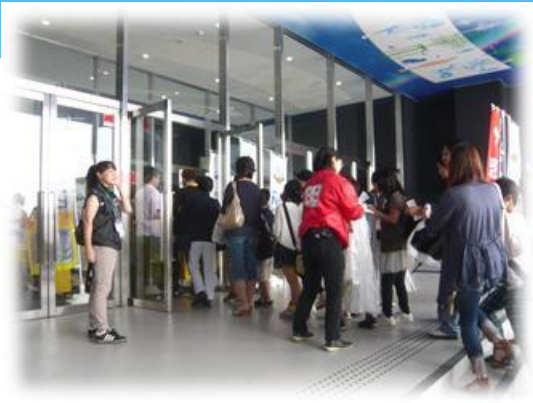
もぎり、サンプリング