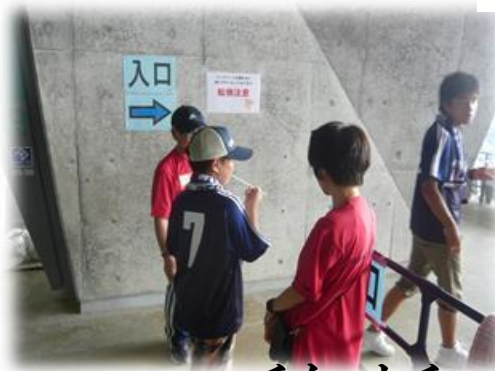
チケットチェック