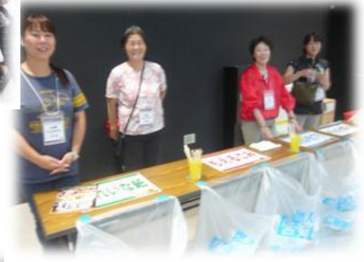
エコステーション、清掃