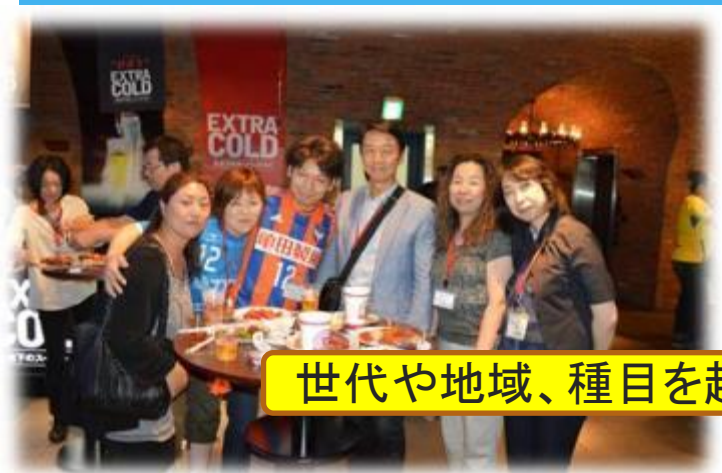
世代や地域、種目を越えた交流