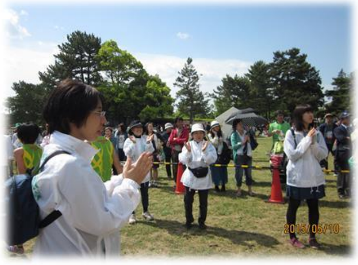
仙台国際ハーフマラソンボランティア