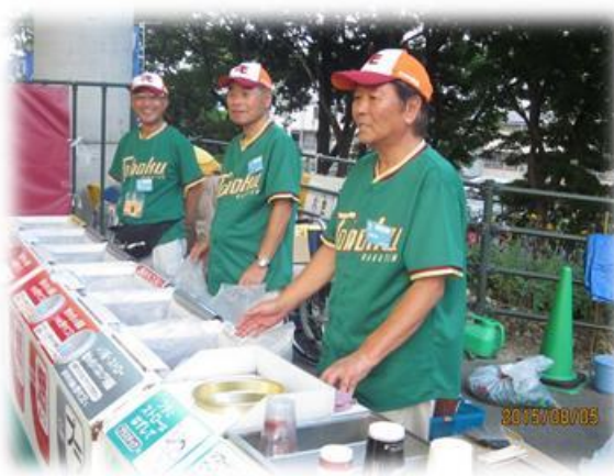
楽天イーグルスボランティア