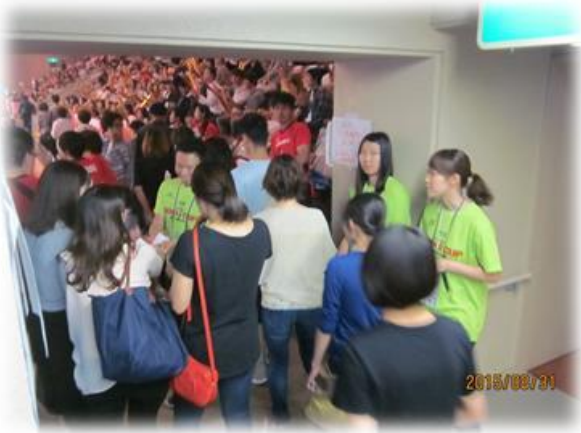
ワールドカップバレーボール女子仙台大会