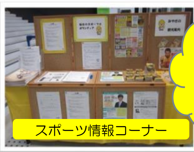
スポーツ情報コーナー