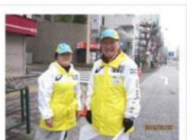
体験研修(東京マラソン・新潟)