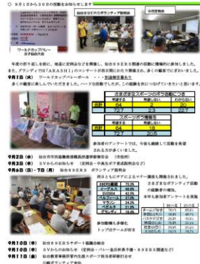
市民スポーツボランティア SV2004 「スポーツで笑顔を未来へ」 ニュースレター2015年10月1日号