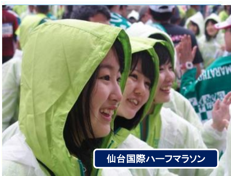
仙台国際ハーフマラソン