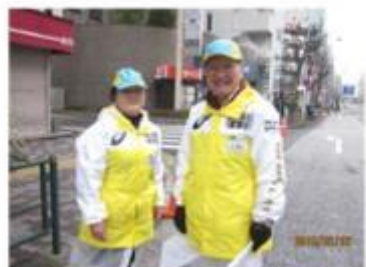
体験研修(東京マラソン・新潟)