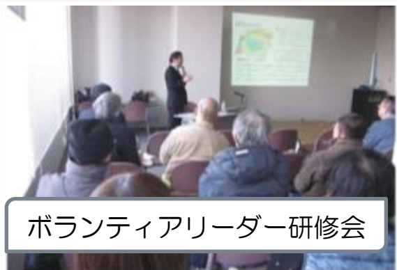
ボランティアリーダー研修会