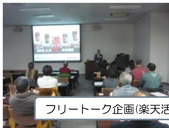
フリートーク企画(楽天活動報告・全国事例発表など)